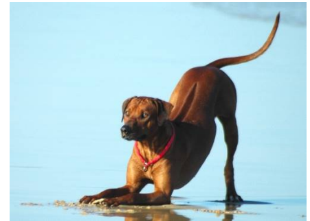
Met deze spelboog geeft de hond aan dat hij wil spelen

Stoeien met een hond is niet altijd een goed idee. U moet namelijk goed weten wat u doet, uw hond goed kunnen lezen en in de eerste plaats een goede verstandhouding met uw hond hebben. Honden die met elkaar stoeien, geven tijdens dat spel allerlei signalen waaruit duidelijk wordt dat ze hun 'aanvallen' niet serieus bedoelen. Voor ons als mens is het moeilijker om dit aan de hond duidelijk te maken en de hond moet wel zeker weten dat u het als spel bedoelt, anders ontstaan er gevaarlijke situaties. Bovendien kan de hond tijdens het stoeien verkeerde dingen leren, zoals dat het toegestaan is om met zijn tanden uw armen te pakken. Ook kan een hond te opgewonden worden en dan doorslaan in agressie (net zoals kinderen die heel druk spelen soms ineens echt ruzie kunnen krijgen). Als het spel niet helemaal duidelijk is, kan het de hond in verwarring brengen over uw bedoelingen, en kan hij van u schrikken of denken dat hij zich moet verdedigen. Toch kan stoeien ook uw band met de hond versterken als u op een aantal basiszaken let.