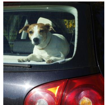
Dit is levensgevaarlijk!

Als uw huisdier niet gewend is om met de auto te reizen, is het verstandig van tevoren enkele korte ritjes te maken. Zorg onderweg voor een veilige plaats in de auto. Honden kunnen in een reiskennel reizen, maar er zijn ook speciale hondengordels. Deze hondengordels of reiskennels zijn in sommige landen, waaronder Duitsland, verplicht! Laat de hond er van tevoren aan wennen. Zet de hond niet voorin op de bijrijdersplaats, zeker als daar een airbag zit, en laat hem nooit reizen op de hoedenplank. Een kat kunt u het beste in de reiskooi houden. De kat voelt zich dan veiliger en het voorkomt ongelukken. Het los meenemen van dieren is gevaarlijk. Denk bijvoorbeeld aan de gevolgen van een botsing, het ontsnappen van uw huisdier of een dier dat onder de pedalen kruipt!