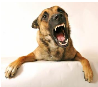
Honden hebben scherpe tanden!

Honden waarschuwen ook. Als jij bij een hond iets doet wat hij niet leuk vindt, zegt hij ook: ik vind dat niet leuk, stop er nou mee! Dat doet hij natuurlijk niet met woorden, maar met zijn lijf en met geluiden. Dat waarschuwen noemen we: dreigen. Maar als jij dat niet begrijpt, ga je gewoon door. Misschien probeert de hond dan nog een keer om jou te vertellen dat je moet stoppen. Maar als dat niet helpt, is de kans groot dat hij gaat bijten.