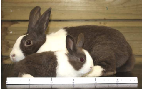
Hollander met moeder, 30 dagen

De strepen op de maatbalk geven steeds 5 cm aan.