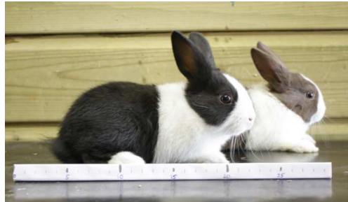
Hollanders, 42 dagen