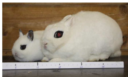
Kleurdwerg met moeder, 26 dagen