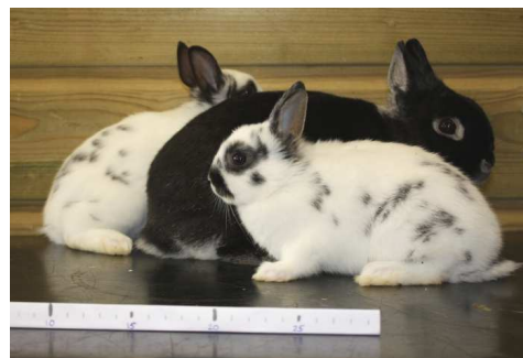
Kleurdwergen met moeder, 46 dagen