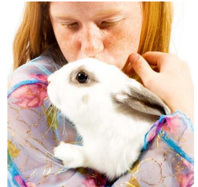
Dit konijn is niet ontspannen!

Kijk hoe het konijn op u reageert. Zit het er ontspannen bij als u het aait? Vindt het konijn het vervelend om opgetild te worden? Veel konijnen vinden dit eng, als prooidier hebben ze graag hun pootjes op de vloer zodat ze kunnen vluchten als dat nodig is. Vastgehouden worden lijkt voor hen al snel op gegrepen (en opgegeten) worden. Het kan soms lastig zijn om te zien dat een konijn het eng vindt: niet elk konijn probeert meteen te vluchten. Een konijn dat gespannen is, spert zijn ogen open en trekt vaak de neus aan de zijkant wat in terwijl de bovenkant van de neus iets opgetild wordt, waardoor de neus er puntiger uitziet dan als het dier ontspannen zit. Zijn spieren voelen gespannen aan. Maar er zijn ook konijnen die er helemaal aan gewend zijn en er geen bezwaar tegen hebben om gezellig bij u op schoot te zitten. Overigens kunt u ook prima uw konijn aaien en knuffelen als u zelf op de grond naast het konijn gaat zitten, bijna elk konijn dat mensen gewend is vindt dat wel prettig.