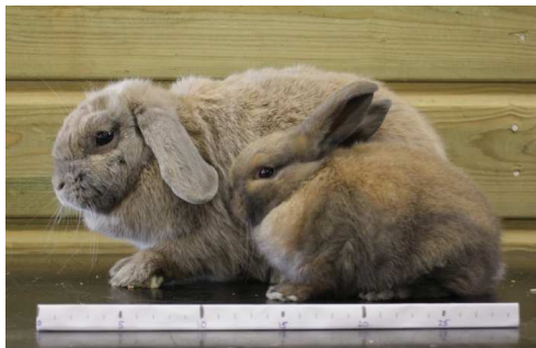
Nederlandse hangoordwerg met moeder, 40 dagen. De oren gaan pas hangen als de dieren wat ouder zijn!