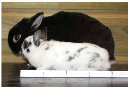
Kleurdwerg met moeder, 34 dagen