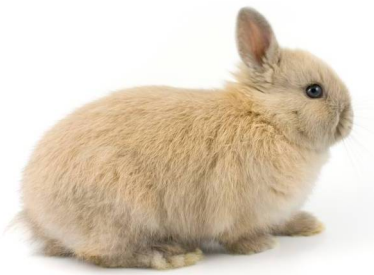
Dit is een dwergkonijntje